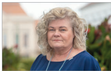
Brunsvik-díjas óvónő 2. oldal