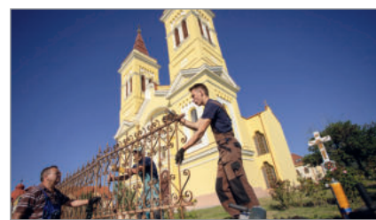
Közösségi összefogás 3. oldal

A Debrecen-Nyíregyházi Egyházmegye állami segítséggel 50 férőhelyes idősotthont épít városunkban a Szilassy János utca 1. szám alatt, a római katolikus templomkertben.