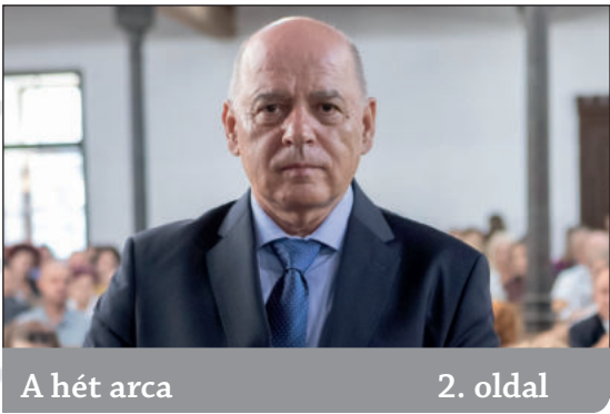
A hét arca