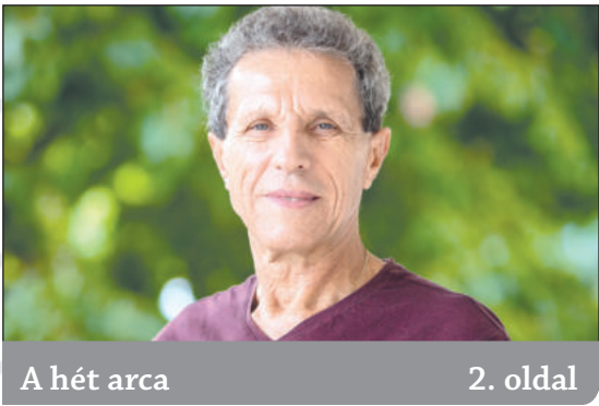
A hét arca