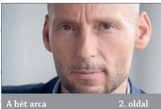
A hét arca