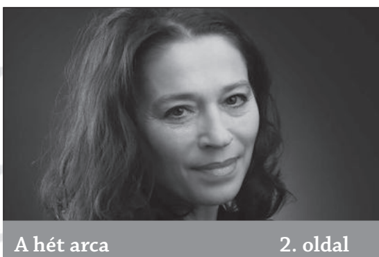
A hét arca