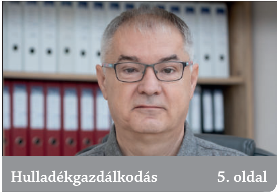
Hulladékgazdálkodás 5. oldal