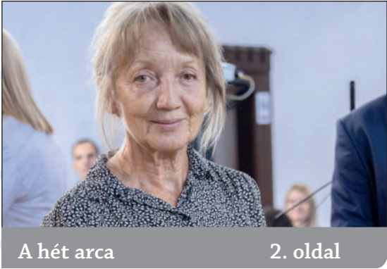
A hét arca 2. oldal