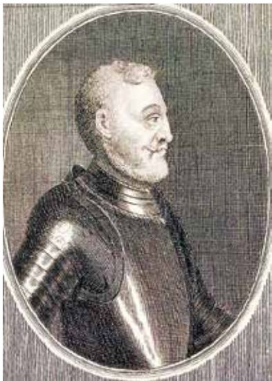
Báthory Gábor, a hajdúk Bösörménybe telepitője

A letelepítés nem csupán jutalom, hanem kényszermegoldás is volt, mivel Bocskai jelentős zsoldhátralékot halmozott fel katonái felé, és az is kiderült, hogy a harcok megszűnte után a hajdúk tömegeit nem fogják tudni tovább zsoldban tartani. A fejedelem halálával azonban a kérdés rendezését mindenáron óhajtó központi akarat megszűnt, a hajdúk letelepítésének ügye akadozni kezdett. Bár a katonák hangoztatták, hogy: „gyermekesgüinktől fogva szablyánkkal esszük kenyereinket,” még az is előfordult, hogy helyenként adózásra akarták fogni őket. Bár voltak óvatosságra intő jelek, miszerint „a füstölő tüzet nem köllene piszkálni,” a csá-