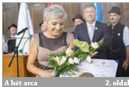
A hét arca