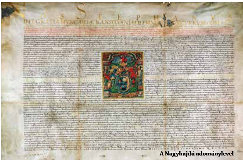
A Nagyhajdú adománylevel

Az 1591-ben kezdődő tizenöt éves háború hozta el annak a társadalmi rétegnek a magyar történelemben játszott kiemelkedő szerepét, amely csoportosra egybefonódott Bösörmény történetével is. A kivívott sikerben, a magyar rendek győzelmében oroszánrésze volt a hajdúknak, akik ezért joggal várhatták a hálát. Bocskai 1605. december 12-én, Korponán kiadott kiváltságlevelében 9254 hajdú katona vágyát váltotta valóra: földet és szabadságot adott nekik.