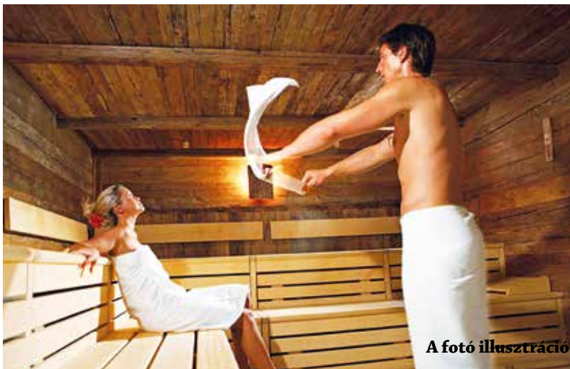
A fotó illusztráció

A Hajdúböszörményi Bocskai Strand- és Gyógyfürdőben tavaly óta rendszeresen tartanak szauna szeánszokat. Nagyon népszerű és