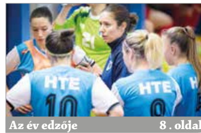
Az év edzője