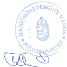
Kiss Attila polgármester