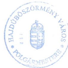
Kiss Attila polgármester