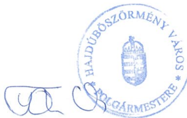
Kiss Attila polgármester