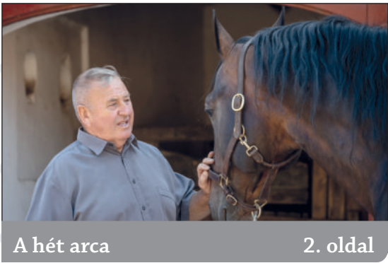
A hét arca