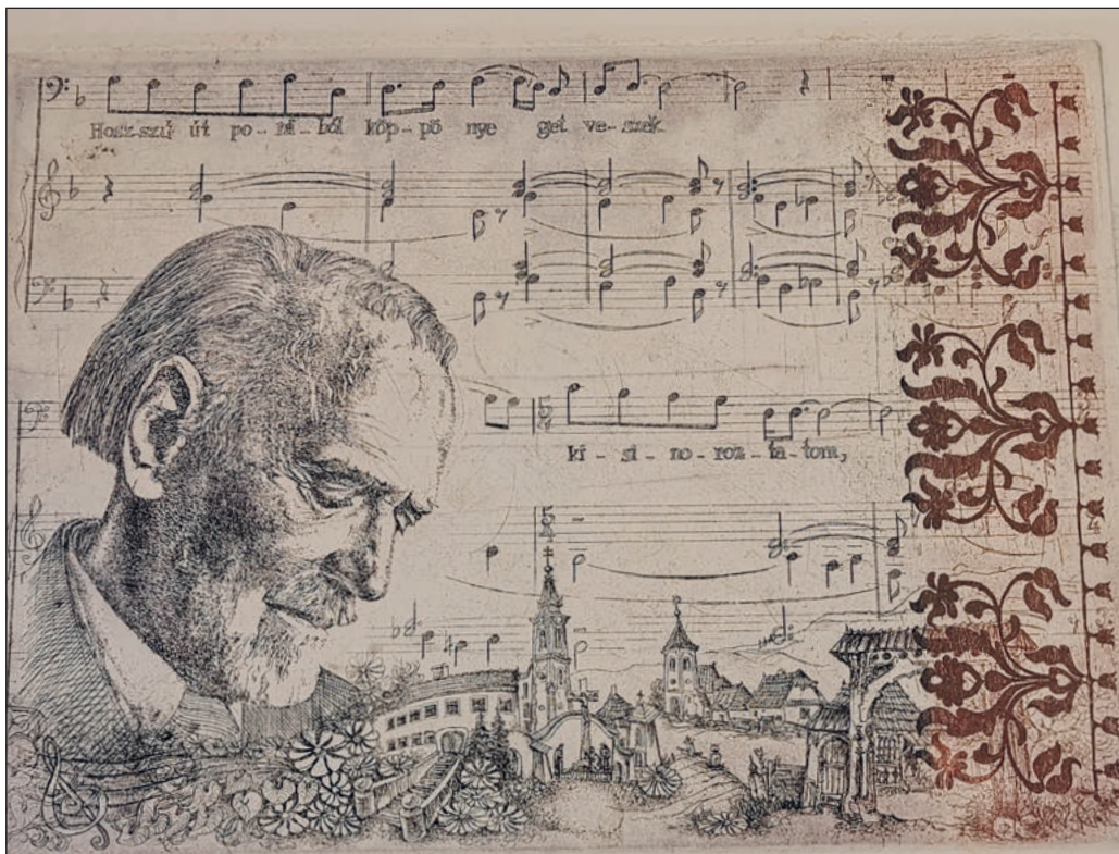
In memoriam Kodály Zoltán (rézkarc)