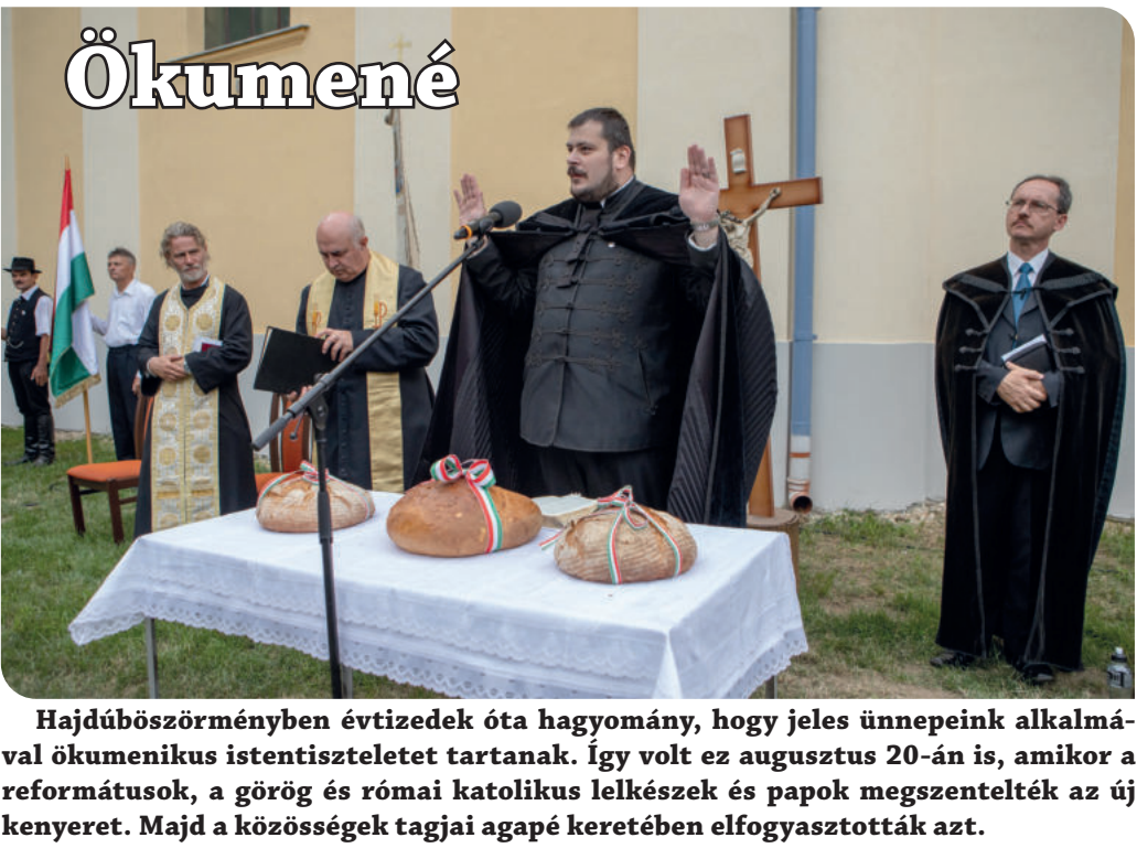
Hajdúböszörményben évtizedek óta hagyomány, hogy jeles ünnepeink alkalmával ökumenikus istentiszteletet tartanak. Így volt ez augusztus 20-án is, amikor a reformátusok, a görög és római katolikus lelkészek és papok megszentelték az új kenyeret. Majd a közösségek tagjai agapé keretében elfogyasztották azt.