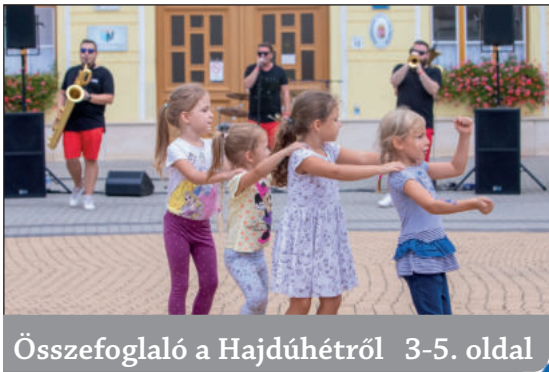
Összefoglaló a Hajdúhétről 3-5. oldal

Nemzeti ünnepünk előestéjén a zeleméri templomromnál emlékeztek a jelenlévők Szent István királyra.