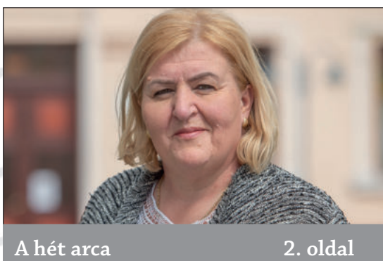
A hét arca