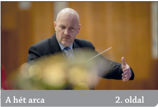
A hét arca