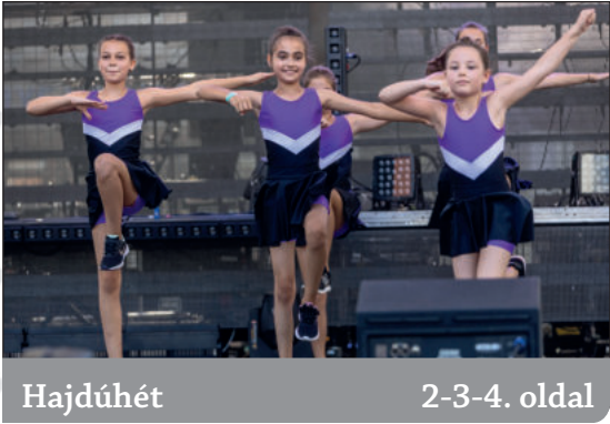
Hajdúhét 2-3-4. oldal