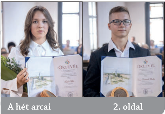
A hét arcai