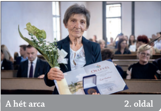
A hét arca2. oldal