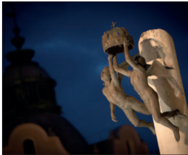
Címek a tartalomból