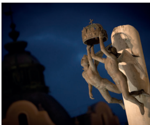
Címek a tartalomról