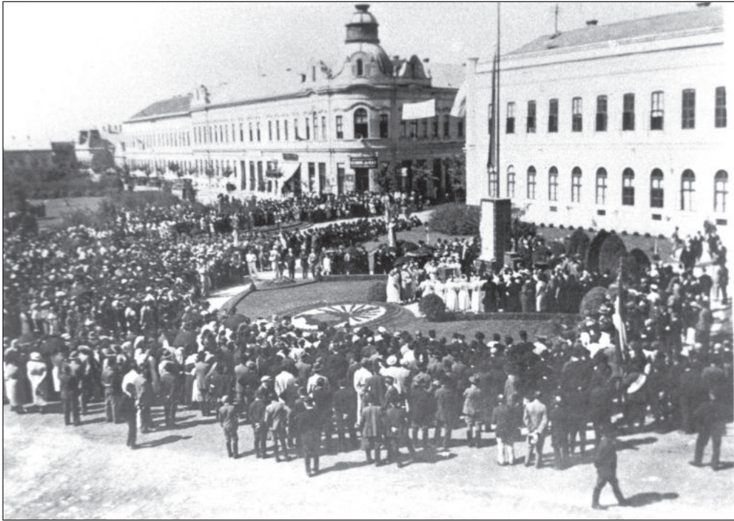
A helyi értéktárban szerepel az 1937-es Hajdúhét. A felvétel az országzászló avatását örökítette meg

V. I.: Ez folyamatosan valósul meg. Kitűztünk egy alapvető célt, hogy a helyi értékeket megőrizzük, és nyomot hagyjunk a közvéleményben ezekkel kapcsolatban. Ezt a vállalkozásunkat fo-