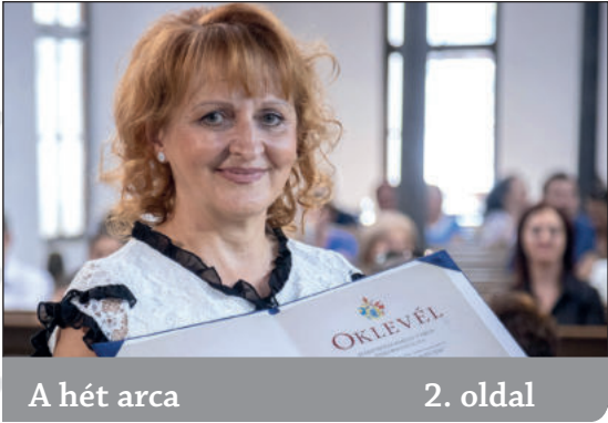
A hét arca