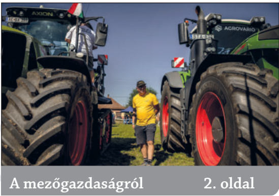
A mezőgazdaságról2. oldal