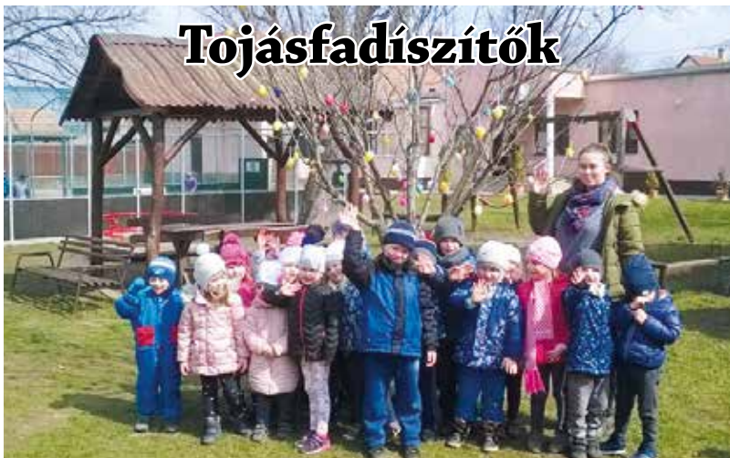
Közös tojásfadíszítással készültek a húsvétra a Csillagvár Óvoda Kölcsey utcai telephelyén a gyerekek, szülők és pedagógusok