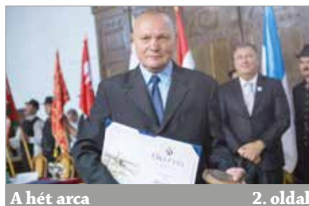
A hét arca