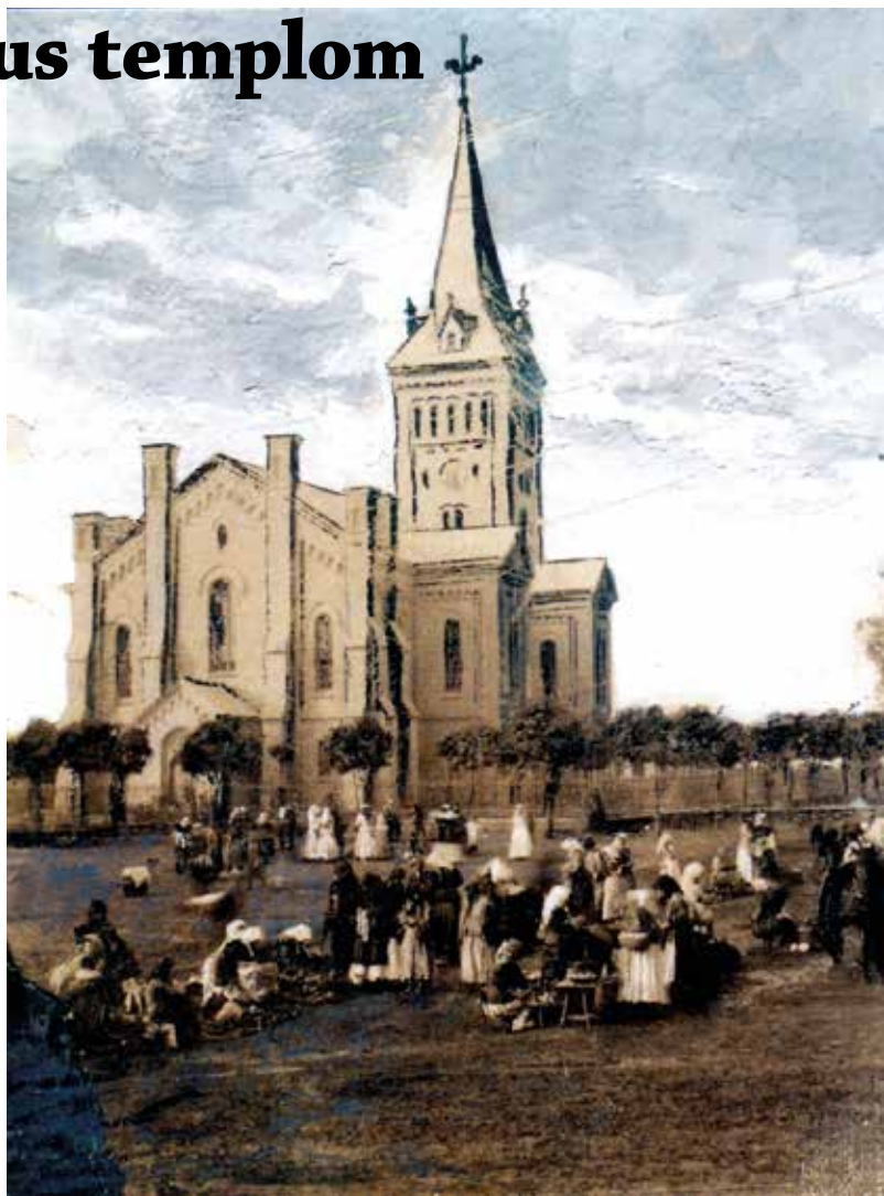
Az átépítés után továbbra is a főtéren működött a városi piac

A templom belsejében teljes összhangot láthatunk a külső megjelenéssel, igaz, itt a művészi megvalósítás fában ölt testet. A felső mennyezet arányosan tagolt, a keleti oldalon lévő karzat, illetve szószék, a stallumus papszék dicséri alkotóikat. A szószék fölött látható a hajdúk címere, melyen égszínkék alapon tojásdad pajzsos, nyakát fejére tekerő sárkánykígyó látható, hasán vörös keresztrel. A pajzs belsejében páncélozott, ezüstsínnű jobb kar, amely magyar típusú szablyát tart, felette elsültni látszó pisztoly, heraldikailag jobb oldalon lobogó, füsttel vegyített láng, balra pedig emberarcú nap látható. A pajzs fölött vitézi nyílt sisak, felette rangjelző korona, amelyből derékből növekvően ábrázolt hajdúvitéz