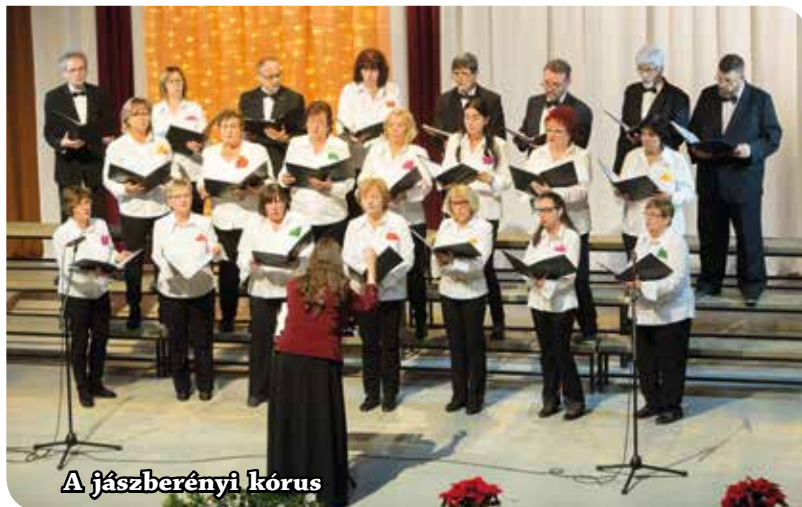
A jászberényi kórus

tag énekelt a vegyeskarban a negyven év alatt. Elmondta még: zene, éneklés nélkül ugyan lehet élni, csak nem érdemes. Mert, ahogy Giuseppe Ottavio Pitoni, a nagy olasz zeneszerző egyik kórusművében komponálta: „Boldog, aki énekel!” A darócisok márpedig bol-