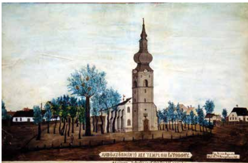
Sóvágó Imre rajza 1881-ből. Templom és torony

Felirata: „a világháborúba vitt harangok helyett Isten dicsőségére öntette a hajdúböszörményi reform. egyház közönsége 1922.”