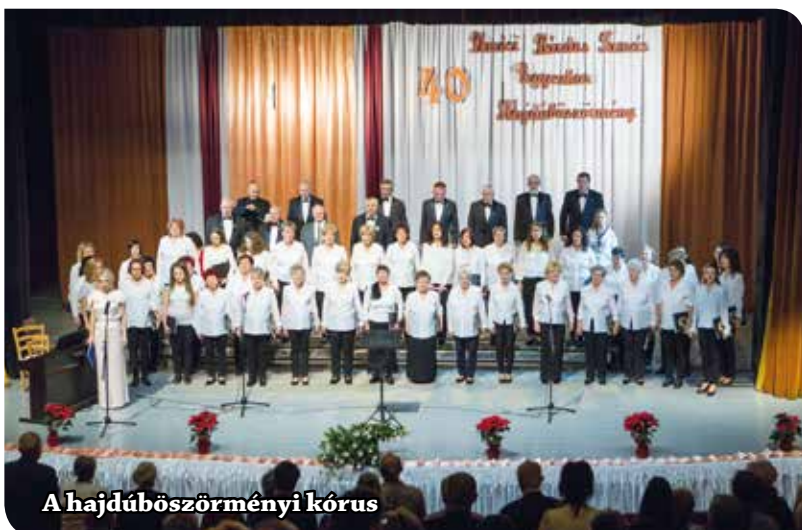
A hajdúböszörményi kórus