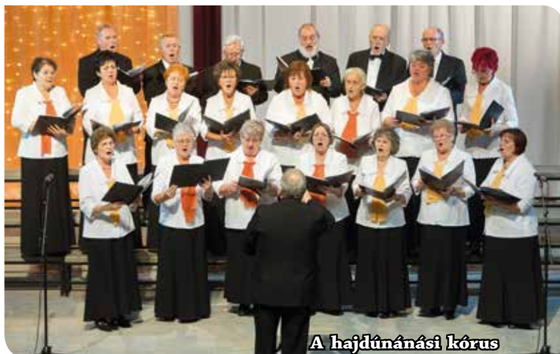
A hajdúnánási kórus

Az egykori kórustagok közül többen is fontosnak érezték, hogy együtt énekelhessenek társaikkal, felidézve a régmúlt időket. Negy-