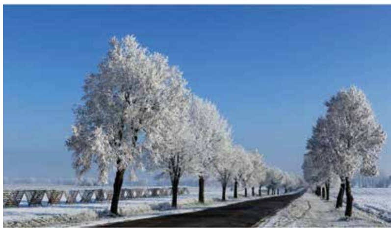
A naptár januári képe, Molnár Antal: Bodai bekötőút

A kiíró olyan fotókat várt, amelyek személyes inspirációk, benyomások alapján, igényes formában jelenítik meg Hajdúböszörmény értékeit, legyen az épített környezeti, természeti érték, szellemi kincs vagy személy. A pályázatra 13 alkotótól, közel 100 alkotás