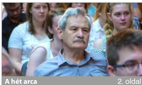
A hét arca