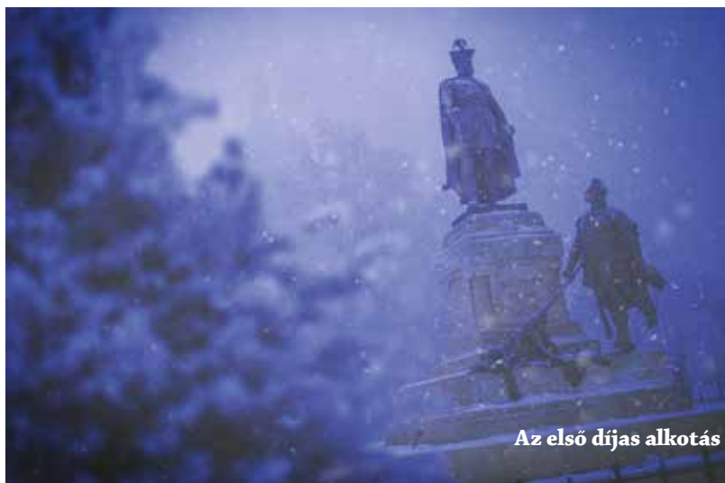
Az első díjas alkotás