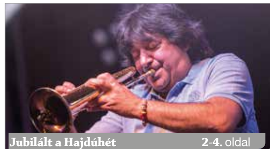
Jubilált a Hajdúhét