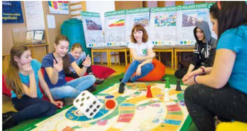
A programok szervezésében és megvalósításában nyújtanak segítséget a kulturális szakemberek

Hajdúböszörményben a közfoglalkoztatás keretein belül több módon is segítik a munka világába igyekvőket. A startmunkaprogram mellett például kulturális közfoglalkoztatásra is lehetőség nyílik. Ha pedig szigorúan csak a számokat tekintjük, az elmúlt nyolc esztendőben 7336 foglalkoztatott számára kínált lehetőséget a program.