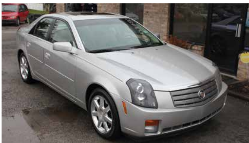
Reális alternatívája egy benzines BMW-nek vagy Mercedesnek

A motor hirtelen felpörgő 215 lóerős hathengeres, melynek hangja megfelelő a magasabb fordulatszám-tartományokban is. Finoman változtat az öte sebességes automata, nem imbolyog, a több mint két tonnás kaszni. Mindent tud, ami a kényelmes autózáshoz kell, és a presztízse is megfelelő. Tényleg hat az érzelmekre is, mindenki elismeri a márkanév hagyományait, akivel találkozom, a nagyság és pazar luxuscirkáló színönimájaként tekint rá. Nagy fogyasztású, és nagy az