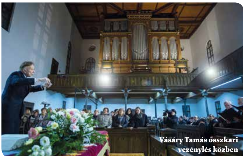
Vásáry Tamás összkari vezénylés közben