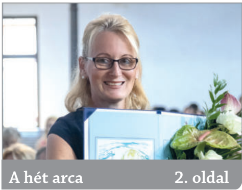
A hét arca