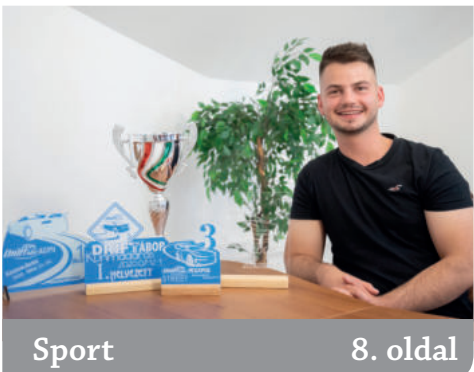
Sport 8. oldal