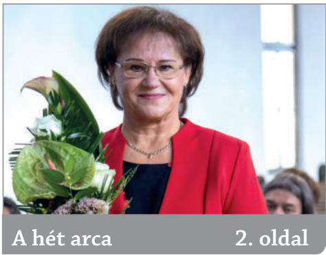
A hét arca