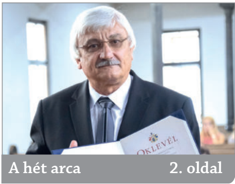
A hét arca