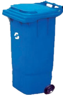
Hajdúsági Hulladékgazdálkodási Nonprofit Kft.

Helyette október 30-án , szombaton történik a hulladékszállítás. A megszokott helyre az elszállítani kívánt hulladékot kérjük, reggel 6 óráig helyezték ki.