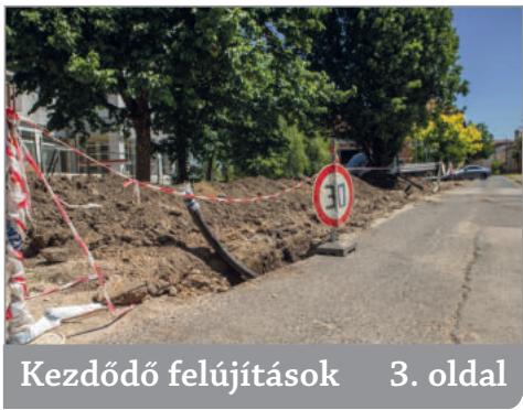
Kezdődő felújítások 3. oldal