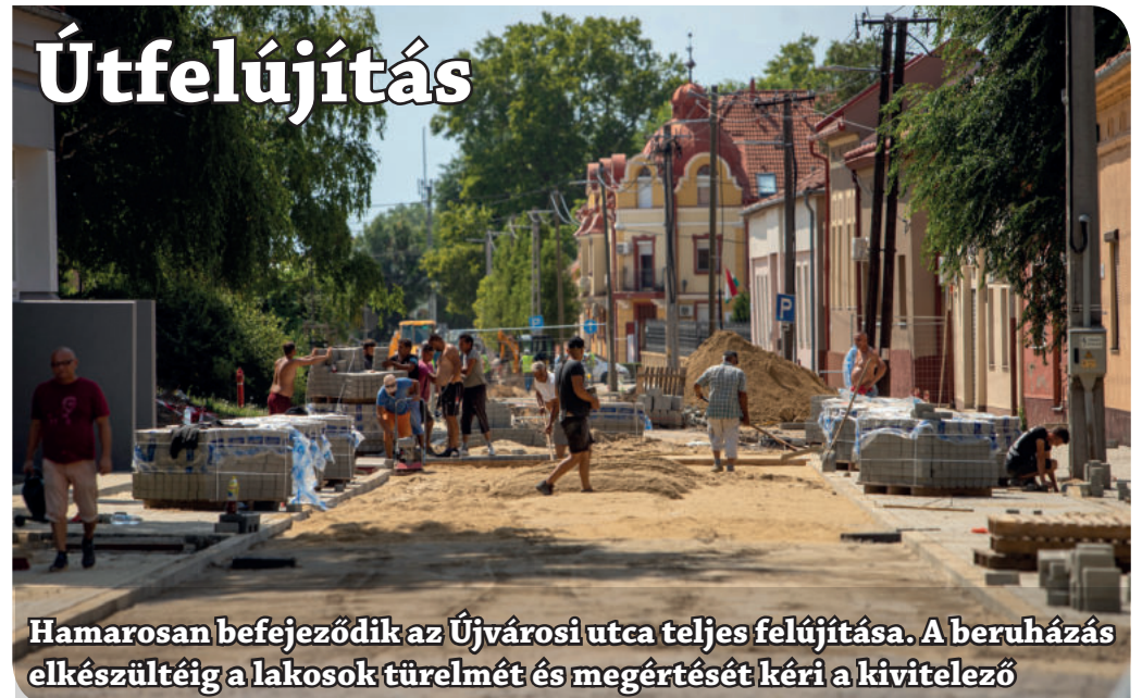
Hamarosan befejeződik az Újvárosi utca teljes felújítása. A beruházás elkészültéig a lakosok türelmét és megértését kéri a kivitelező