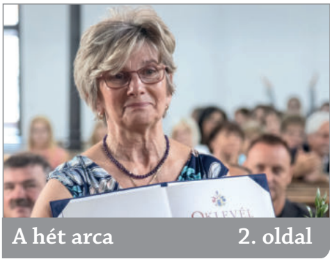
A hét arca