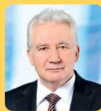
JAKAB ISTVÁN A PARLAMENT ALELNÖKE